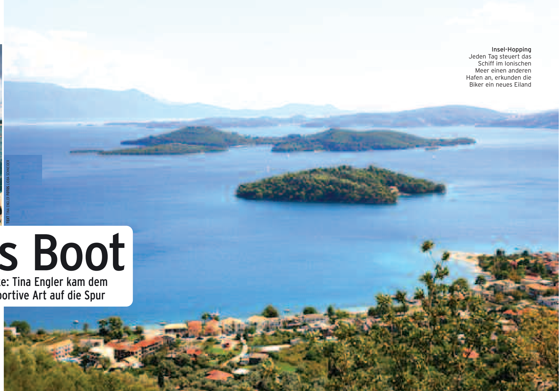
Insel-Hopping Jeden Tag steuert das Schiff im Ionischen Meer einen anderen Hafen an, erkunden die Biker ein neues Eiland