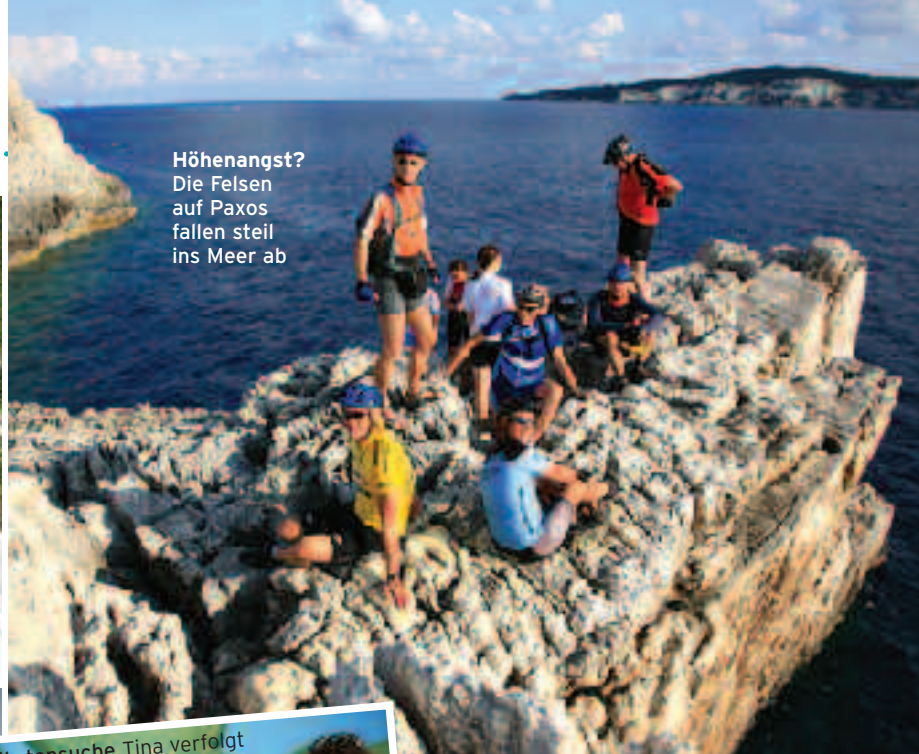
Höhenangst? Die Felsen auf Paxos fallen steil ins Meer ab