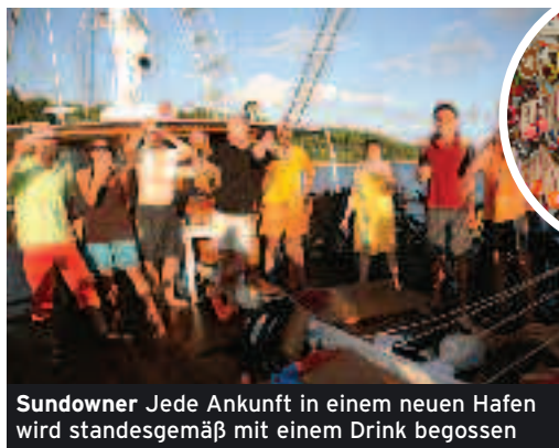
Sundowner Jede Ankunft in einem neuen Hafen wird standesgemäß mit einem Drink begossen

wegen ab, dunkle Tannen schmiegen sich an die Hänge. Wir radeln über Schotterpisten, vorbei an Höhlen und durch tief durchfurchte Lehm-pfade. Schroff fällt die Steilküste hin-ab ins Meer. Und plötzlich liegt er unter uns: der Myrtos Beach. In rasan-tem Tempo fahren wir runter zum Traumstrand und kühlen uns in den Fluten ab. Danach brechen wir nach Agia Eufemia auf, wo unser Kapitän schon mit einem leckeren Barbecue auf uns wartet. Inselhüpfen und an-spruchsvolle Mountainbiketouren auch in den nächsten Tagen: Auf Ithaka wandeln wir auf Odysseus' Spuren, setzen dann wieder nach Lefkada über, wo wir in Nidri Gele-genheit haben, Souvenirs zu erstehen. Der sechste Tag ist ein Seetag. Es ist stürmisch und die Überfahrt von Ithaka zum griechischen Festland nach Sivota dauert fast sieben Stun-den. Das raue Wetter macht uns zu