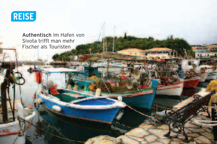
Authentisch Im Hafen von Sivota trifft man mehr Fischer als Touristen