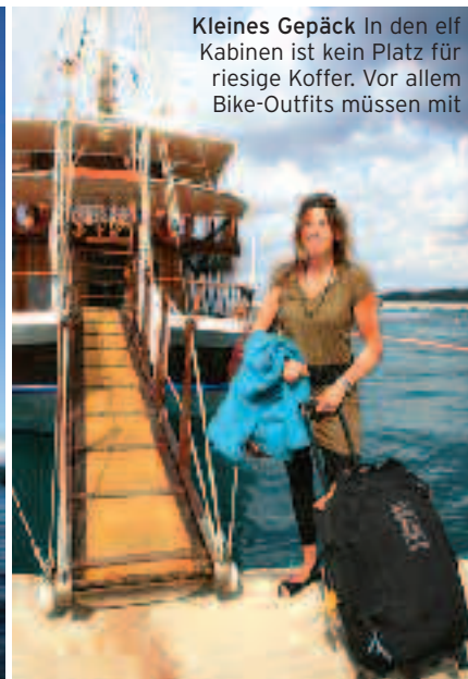
Kleines Gepäck In den elf Kabinen ist kein Platz für riesige Koffer. Vor allem Bike-Outfits müssen mit