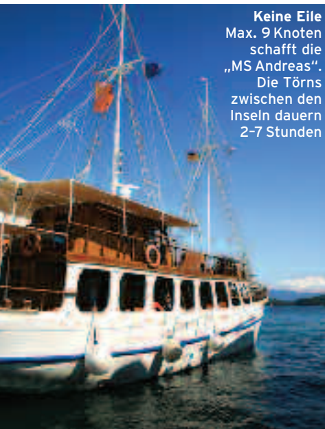
Keine Eile Max. 9 Knoten schafft die „MS Andreas“. Die Törns zwischen den Inseln dauern 2-7 Stunden