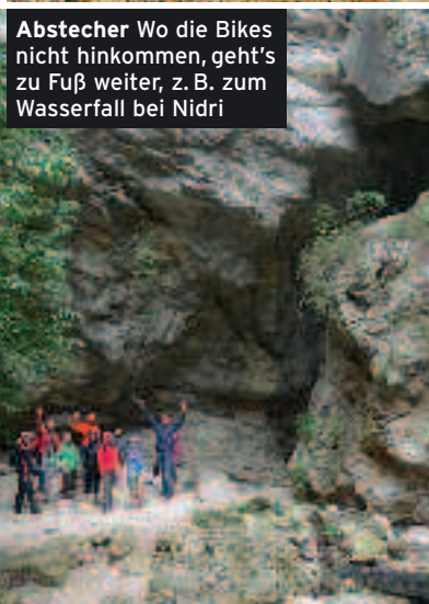
Abstecher Wo die Bikes nicht hinkommen, geht's zu Fuß weiter, z. B. zum Wasserfall bei Nidri