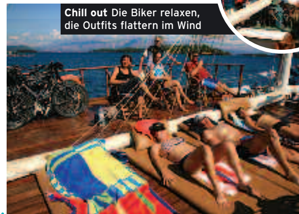
Chill out Die Biker relaxen, die Outfits flattern im Wind

auch unser Boot wartet bereits, um uns zur nächsten Insel, Kefalonia, zu bringen. Von Weitem sehen wir die bunten Häuschen im Hafen von Fiscardo, alles mutet sehr italienisch an. Für heute ist Nightlife in den Hafensbars angesagt, doch um elf sind wir so müde, dass wir den Heimweg antreten. Am dritten Tag ist der Schweinehund endgültig besiegt! Kefalonia, mit 781 qkm die größte Ionische Insel, ist für ihre zerklüfteten Berge bekannt. 1.628 Meter ragt der Enos aus dem Meer heraus, eine echte Herausforderung für uns! Asphaltstraßen wechseln mit schattigen Wald-