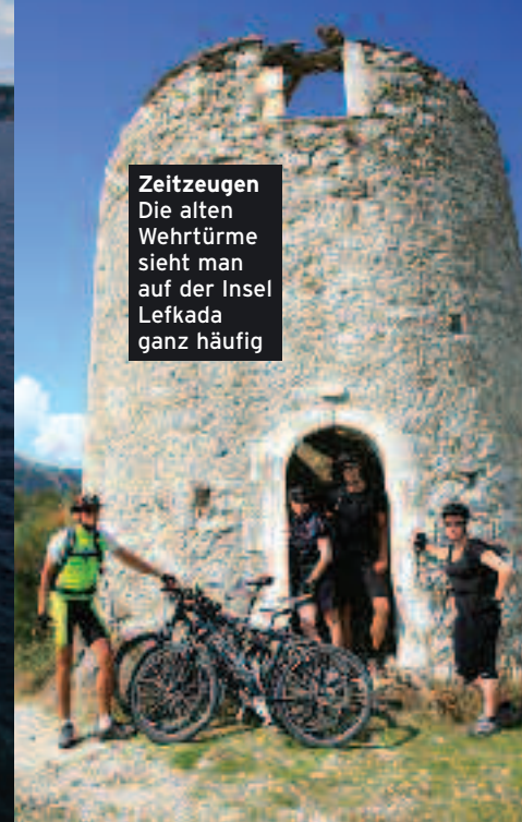
Zeitzeugen Die alten Wehrtürme sieht man auf der Insel Lefkada ganz häufig

ist schwer, meine Beine zittern, ich atme heftig. Auch Christine und Claudia kämpfen. „Nehmt kleinere Gänge“, rät Jan. Ich probiere es aus und es geht gleich viel besser. Vorbei an silbrigen Olivenbäumen und duftender Macchie strampeln wir durch unberührte Natur. Wir spornen uns gegenseitig an und bekommen zur Belohnung fantastische Ausblicke auf das tiefblaue Meer. Als wir nach rund 18 km am Longos Beach ankommen, tummeln sich ein paar Mitfahrer schon im Wasser. Wir gönnen uns an der Strandbar einen kühlen Joghurt-Drink, ehe wir die Rückfahrt antreten. Zurück im Hafen, geht die Sonne langsam unter. Fischer flicken ihre Netze und wir nehmen den Sundowner an Deck. Danach haben wir einen Bärenhunger. Auf dem Büfettürmen sich Hähnchen, Salat, Zaziki und Kartoffeln. Nach der 23 km langen Inselumrundung haben wir uns das Nacht Mahl redlich verdient und sinken danach erschöpft, aber glücklich in unsere Betten. Am nächsten Morgen meldet sich der Muskelkater in den Waden, aber Kneifen gilt nicht. Über Nacht hat Kapitän Yan-nis das Boot nach Lefkada gesteuert und wir werden im Hauptort Lefka-