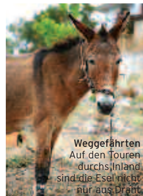
Weggefahren Auf den Touren durchs Inland sind die Esel nicht nur aus Draht

Abends setzen wir mit dem Boot nach Korfu Stadt über. „Kerkira“, wie die Einheimischen den Ort nennen, verzaubert mich auf Anhieb: Ich lasse mich durch die Altstadt treiben, flanriere durch enge Gassen, unter wehender Wäsche hindurch. Ein bisschen Paris, ein bisschen Venedig, Kerkira hat von allem etwas. Unseren Abschiedsabend verbringen wir im „Salon der Stadt“, auf der herrschaftlichen Esplanade. Wir tauschen Adressen und Trainingsversprechen aus. Denn die 3.060 Höhenmeter und 175 km wollen wir bei unserem nächsten Törn in jeden Fall toppen!